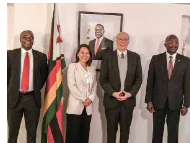
Firma del memorando de entendimiento para la lucha contra el trabajo infantil por ECLT y el Embajador de Zimbabue, Ginebra 2022

En Argentina, ECLT colaboró con la Comisión Provincial para la Prevención y Erradicación del Trabajo Infantil (COPRETI) en la organización de una campaña de concienciación sobre el trabajo infantil y el acceso de los jóvenes a un trabajo decente. La Fundación también prestó asistencia técnica en Buenos Aires, en el marco del Plan Provincial para la Prevención y Erradicación del Trabajo Infantil y la Protección de los Trabajadores Adolescentes, para desarrollar un programa de formación para los facilitadores locales que contribuya a difundir lo que significa el trabajo infantil y las posibles soluciones.